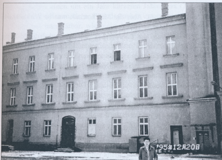
Ehemalige Militär-Oberrealschule Sicht vom Hof aus

war so: nach der befriedigenden Absolvierung der 4. Klasse einer Volksschule trat man in die Militär-Unterrealschule ein, nach dem 4. Jahr in die Militär-Oberrealschule. Dann besuchte man 2 Jahre die Militär-Akademie. Wer diese Akademie mit mindestens „gutem“ Gesamterfolge absolvierte, der wurde Leutnant. Mit „genügend“ wurde man Kadett und mit „ungenügend“ Unteroffizier (B K. 33).