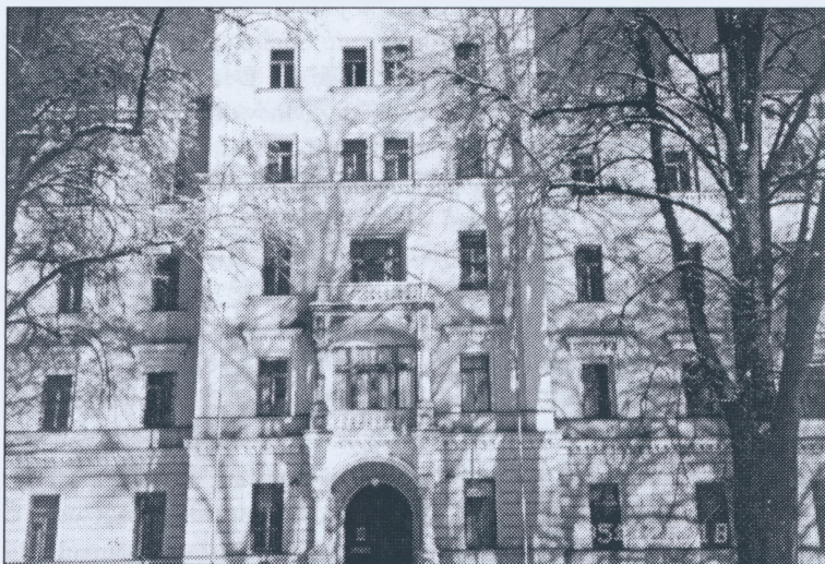
Ehemalige Militärakademie Hauptportal

Wir gingen danach im Korridor Richtung Haupteingang. Die Sockeltäfelung war bis zur Schulterhöhe durchlaufend mit weißen Wandfliesen ausgelegt. Der Boden war ebenfalls mit Fliesen schön ausgelegt. An beiden Rändern des Bodens liefen Streifen, die aus kleineren, blau umrandeten Fliesen bestanden. In jeder zweiten dieser Streifenfliesen blühte abwechselnd ein weißes und ein blaues Blumenmuster. Sonst war der Boden mit größeren weißen Quadraten mit dunkelblauen gleichschenkligen Dreiecken an den Ecken geschmückt, so daß im Gesamteindruck regelmäßige dunkelblaue Rhomben auf dem Boden entstanden. Die Tür zum Eingang hatte ein Oberlicht, das mit dem künstlerischen Muster wie eine Rosette aussah. Herr Raindl erklärte uns, daß diese gefliesten Korridore und die Türanlage original waren.