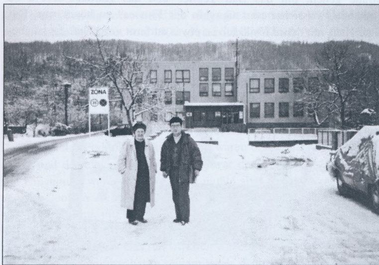
Ehemalige Villa Anna – jetzt umgebaut