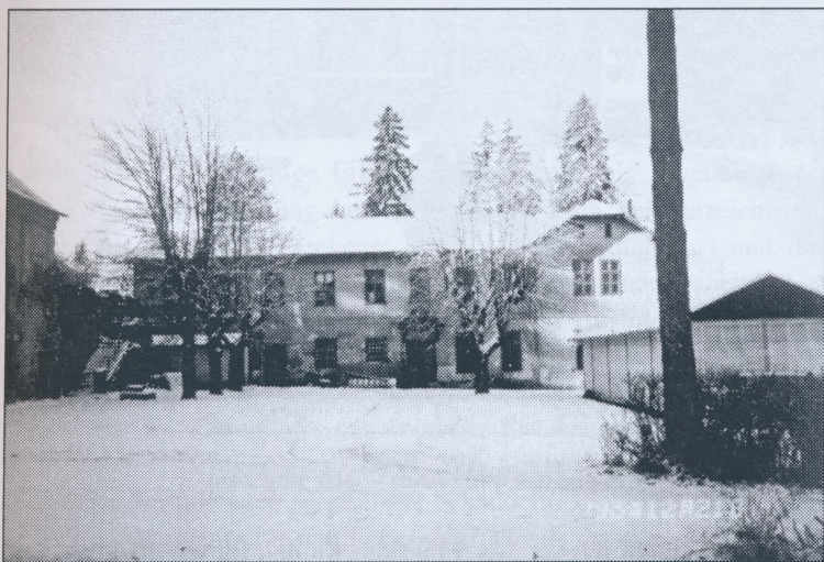
Tanzcafé Nähe Friedrichshof

Straße gehen, um das Bad Teplice und das Kurhaus Bečva zu erreichen, wo sicher „das Gurgeln des Flusses“ zu hören war. Das erste Haus mit dem Musikklub ist etwas entfernt vom Fluß. Es ist aber weder ein quadratisches noch zweistöckiges Haus.